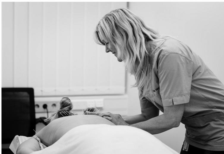
Akupunkturbehandling på studentklinikken.